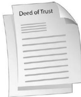
Deed of Trust